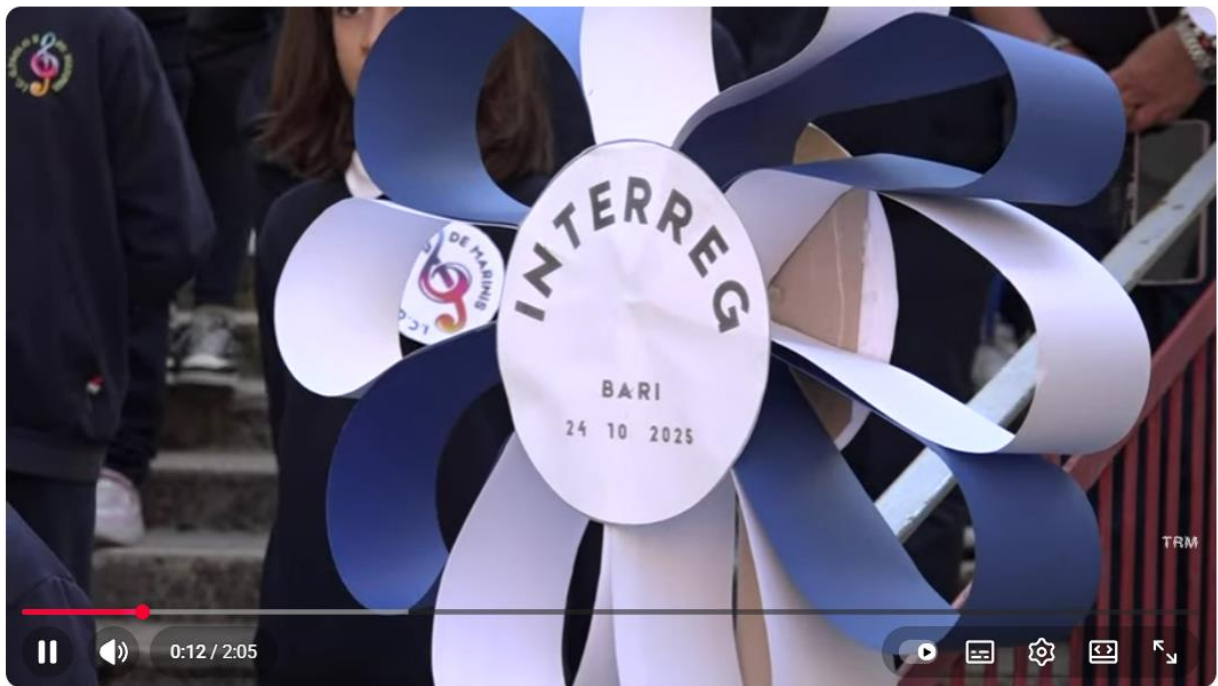
L'interreg Cooperation Day di Bari a portata di bambini

https://www.youtube.com/watch?v=H3P5fjdH2wI